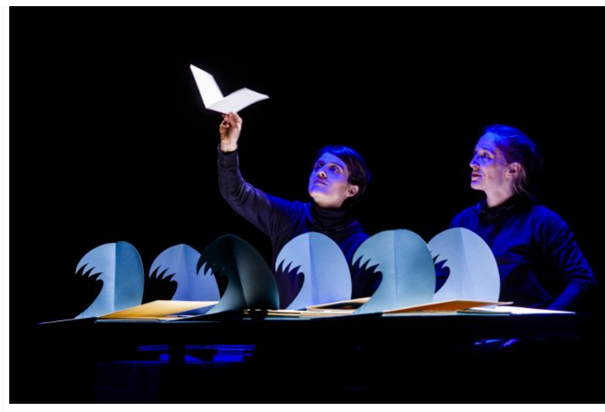
— La companyia italiana Teatro delle Briciole va presentar 'Pop Up' a la 29a Mostra d'Igualada.

Un any més, la capital de l'Anoia s'ha omplert de teatre per a tots els públics en la que ha estat la 29a edició de la Mostra d'Igualada , la fira de teatre familiar que és al mateix temps festival i mercat estratègic. La pluja de dissabte a la tarda va obligar a canviar d'ubicació alguns dels espectacles, però tot i això només es van haver de cancel·lar tres funcions de les 104 programades, de tres companyies que, de fet, tenien altres funcions. Per tant, ningú no es va quedar sense actuar a Igualada.